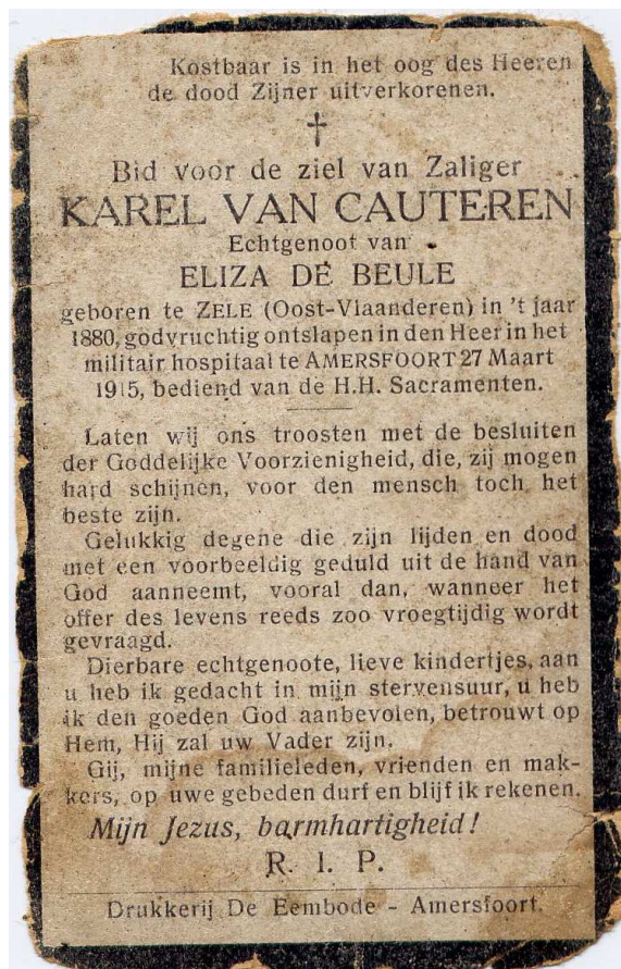
Bidprentje opgesteld te Amersfoort

De weduwe met 2 kinderen had op 10 november 1920 een vragenlijst met betrekking tot het vaststellen van de strijder via het Strijdersfonds ingediend. Het zal nog een tijdje duren vooraleer zij en kinderen van de Belgische overheid een vergoeding ontvangen voor zijn militaire inzet.