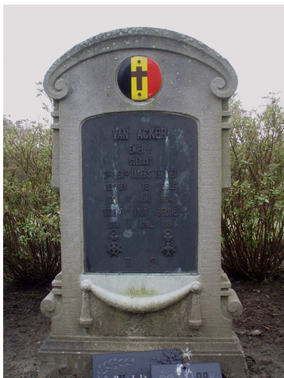
B.M.B. De Panne - graf P0179 (2009)

Later wordt de Zelenaar overgebracht naar de Belgische Militaire Begraafplaats in De Panne waar hij in graf nr. P0179 zijn laatste rustplaats krijgt.