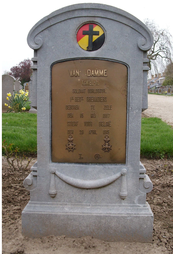
B.M.B. Westvleteren - graf ... (2009)

Tijdens deze dagen geraakt Kamiel gewond. Hij overlijdt in het hospitaal te Lizerne aan de gevolgen van de opgelopen blessure.