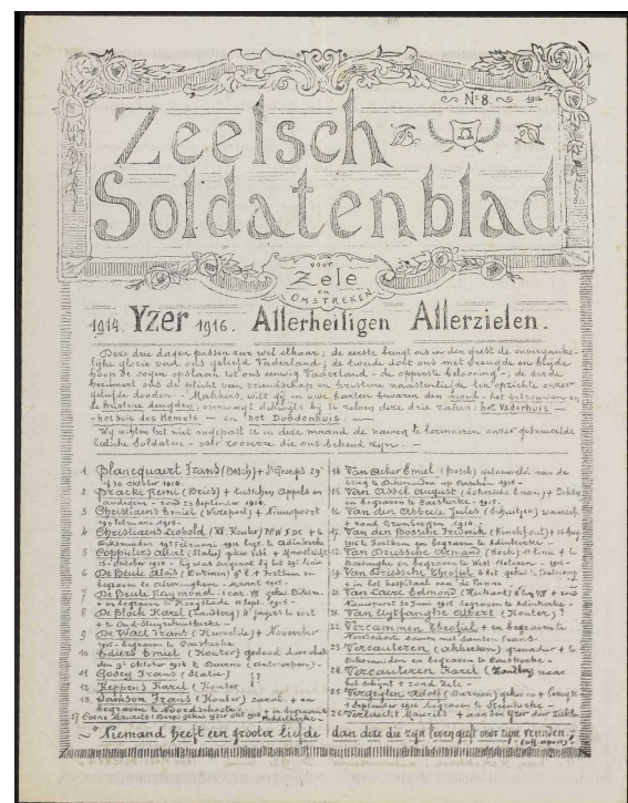
Zeels soldatenblad 1916 nr. 8

Het ondergelopen Stuivekenskerke wordt onderverdeeld. In het noordelijk deel bevinden zich talrijke Duitse posten. In Oud-stuivekenskerke is er de belangrijke Belgische voorpost "De Grote Wacht Zuid". Het is hier dat Carolus dodelijk wordt getroffen.