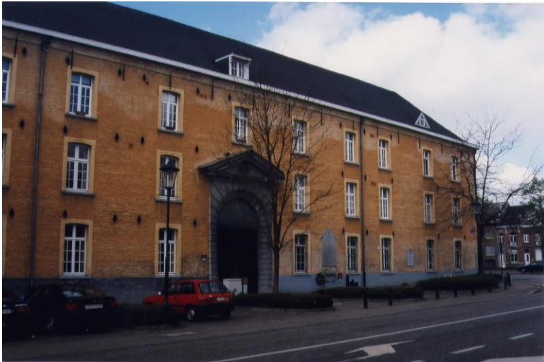
Dossin-kazerne te Mechelen

Zo ook gebeurde dit met de nakomelingen van Gorgan Pontsy. Zij werden op 3 en 6 december 1943 opgesloten in de Dossin-kazerne te Mechelen. Vrij vlug, namelijk op 15