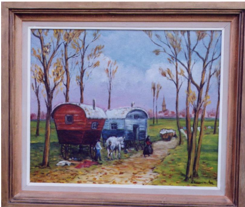
Schilderij “Staanplaats zigeuners” van Gaston Geerinck

van de lokale politie verplichtten de zigeuners om hun standplaats op de Zandberg te verlaten. De karavaan verplaatste zich naar het einde van de Dendermondsebaan, waar toen nog geen huizen stonden. Deze plaats is bij de bevolking beter gekend als “'t Manneke begraven”. Politie en rijkswacht PV's die voorgaande beweringen kunnen staven werden niet bewaard.